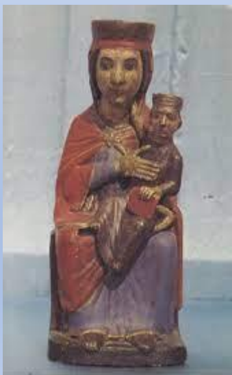
Vera effigie della Madonna della Stella Patrona della città venerata nella Collegiata di Rivoli